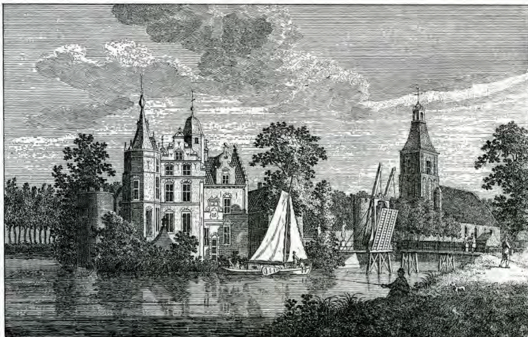
KERK en HUYS te OOSTERWYK.

Dat de geschiedenis van Durendael weer tot leven wordt geroepen, is een goede zaak. Maar we moeten er dan niet omheen draaien dat het kasteel nooit een kasteel is geweest. Dat het huis geen politieke of economische functie binnen de Vrijheid Oosterwijk heeft gehad en dat we absoluut niet weten hoe het er vroeger uitgezien heeft. Misschien moet er maar een monument komen te staan, dat goed aangeeft hoe onverantwoordelijk Oosterwijk in het verleden met het cultuur-historisch erfgoed is omgesprongen. Geen gedenkplek, maar een 'Mahnmal', zoals de Duitsers dat zo mooi omschrijven.